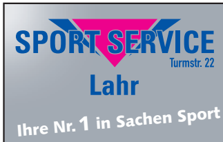
Sport Service Lahr GmbH & Co. KG www.sport-service-lahr.de

An dieser Stelle möchte sich die IG Sport Lahr bei allen Unternehmen, Firmen und Geschäftsleuten, die durch Aufgabe einer Anzeige die Herausgabe der Infobroschüre 2008 möglich gemacht haben, bedanken. Wir bitten alle Leser der Broschüre und besonders die Mitgliedsvereine und Freunde unserer Gemeinschaft, bei ihren Einkäufen und Auftragsvergaben die uns unterstützenden Geschäfte und Firmen zu berücksichtigen. Vielen Dank.