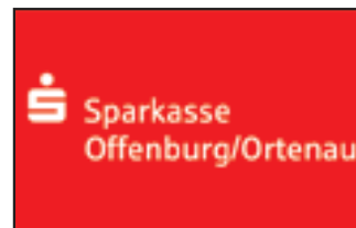
Sparkasse Offenburg/Ortenau, Lahr www.sparkasse-offenburg.de