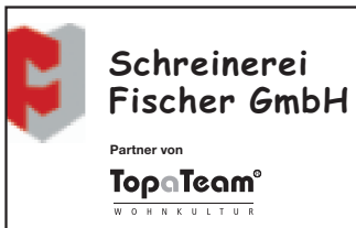
Schreinerei Fischer GmbH, Lahr Tel. (07821) 98 52 86