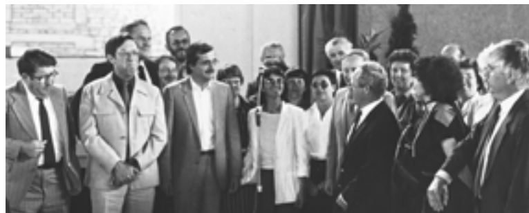
Vorsitzende der IG Sport bei der Partnerschaftspflege mit Dole (1987)