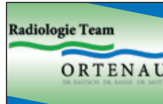
Radiologie Team Ortenau, Lahr Tel. (07821) 91 79-0