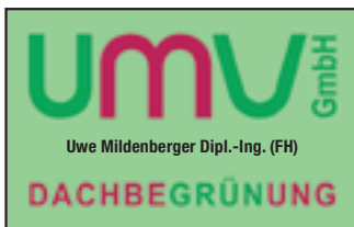
UMV GmbH Dachbegrünung, Lahr Tel. (07821) 98 31 91